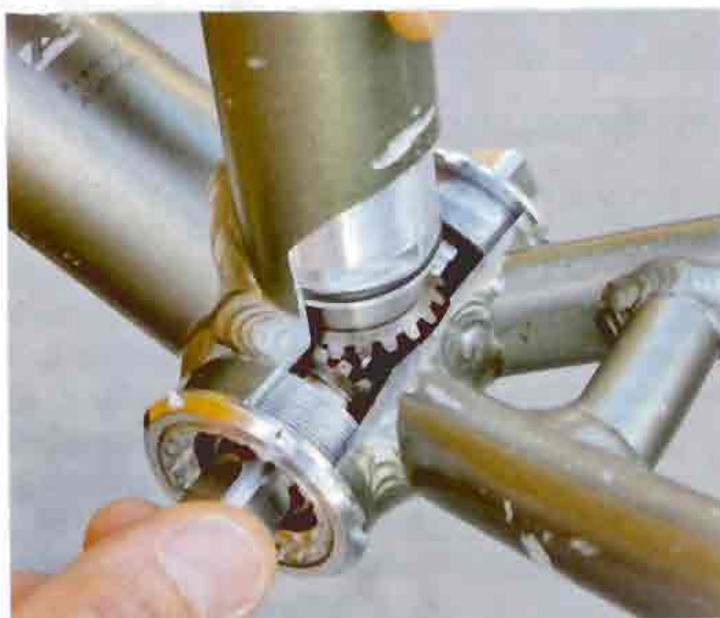
Kraftwerk: Der Gruber-Antrieb sitzt im Sitzrohr und treibt auf Wunsch die Kurbelwelle an.

Ich gebe zu: Ich habe gedopt. Nicht mich, um Himmelswillen. Sondern mein Rad. Im Tretlager steckt unsichtbar eine revolutionäre Weltneuheit. Ein winziger Elektromotor. Durch Kabel in den Rahmenrohren verbunden mit einem Ein- und Aus-Schalter am Lenker. Und einem Hochleistungsakku in der Satteltasche. Man sieht nichts. Außer dem Schalter. Wird der